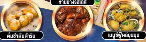
ต้มยำต้นตำรับ