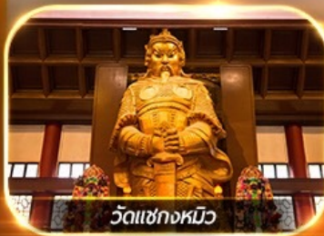
วัดเซกตงหมิว