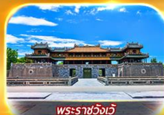
พระราชวังเว้