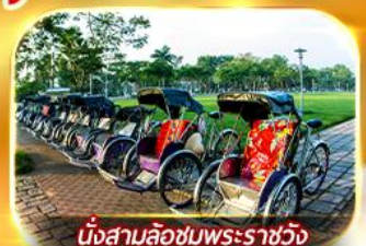
นั่งสามล้อชมพระราชวัง

สัมผัสความสวยงามหมู่บ้านสไตล์ฝรั่งเศสที่บานาวิลล่า วัดเทียนมู่ พระราชวังเว้ สัมผัสเมืองโบราณฮอยอัน ล่องเรือกระดัง