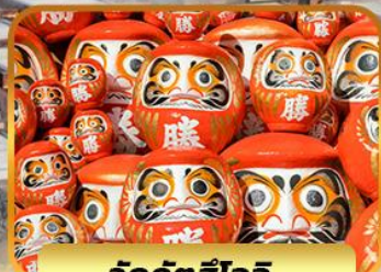
วัดคัตสึโฮจิ