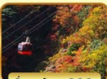
นั่งกระเช้าภูเขาโทโซไซ