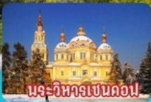
พระวิหารเขนคอฟ