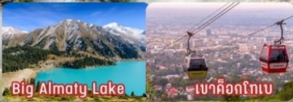
Big Almaty Lake