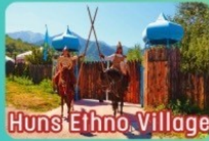
Huns Ethno Village