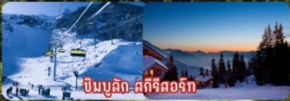
ปีนบุคลิก สกีรีสอร์ท