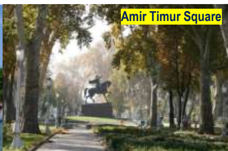
Amir Timur Square