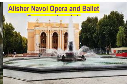
Alisher Navoi Opera and Ballet