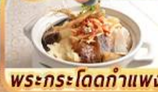
พระกระโดดกำแพง