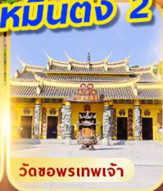
วัดซอพรเทพเจ้า