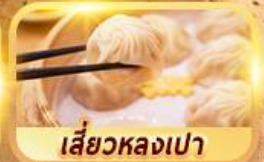
เสี่ยวหลงเปา