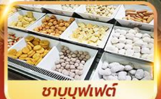
ชาบูบุฟเฟ่ต์