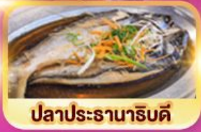
ปลาประจานาริบดี