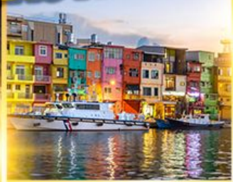
หมู่บ้านประมงเจินปิง