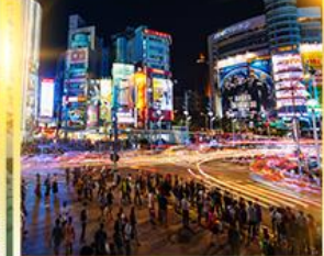
ซีเหมินติง