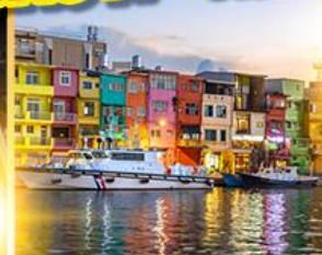
หมู่บ้านประมงเจินปิง