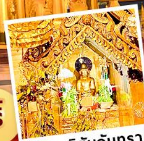
พระสุริยันจันทรา