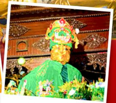
ขอพรแม่ยักยี