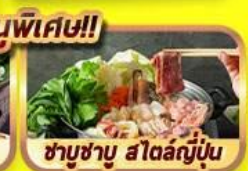
ชาบูชาบู สโตนญี่ปุ่น