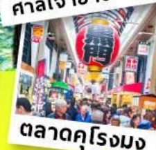
ตลาดคุโรมง