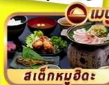
สเต็กหมูฮิดะ