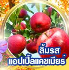
ลิ้มรส แอปเปิ้ลแคชเมียร์