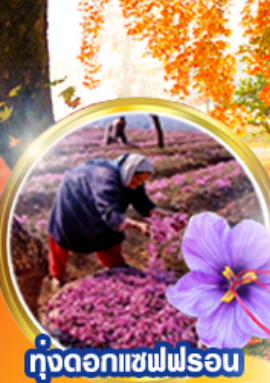
ทุ่งดอกแซฟฟรอน