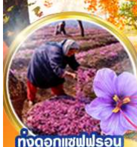
ทุ่งดอกแซฟไฟรอน