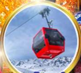
กระเช้ากุลมาร์ค ชมวิวสุดอลังการ