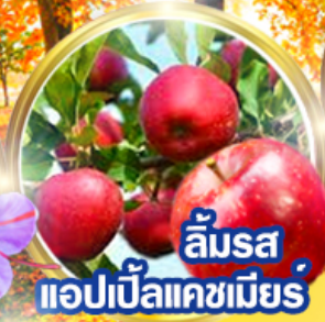
ลิ้มรส แอปเปิ้ลแคชเมียร์