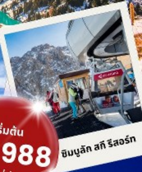
ซิมบูลิก สกี รีสอร์ท