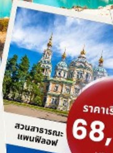
สวนสาธารณะ แพนฟิโลฟ