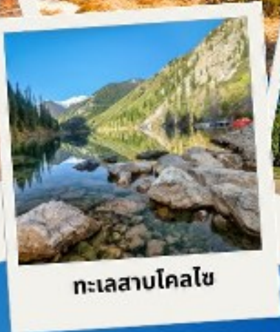
ทะเลสาบโคลไซ