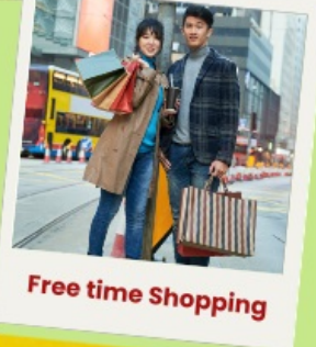
Free time Shopping