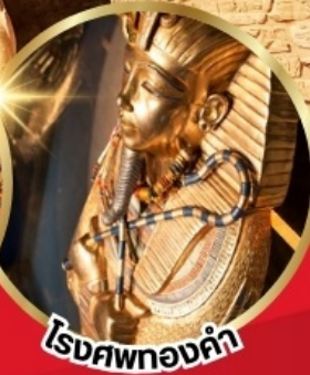
โรงศพทองคำ

บินภายใน 2 เที่ยวบิน จาก CAI - ASW // LXR - CAI