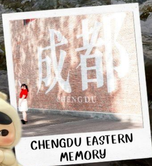
CHENGDU EASTERN MEMORY