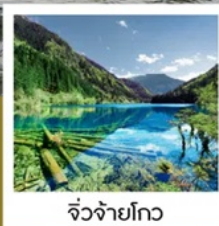
จั๋วจ้ายโกว

จาก 8 ชม. เหลือ 2 ชม. เร็วทันใจด้วยรถไฟความเร็วสูง เฉิงตู - จั๋วจ้ายโกว