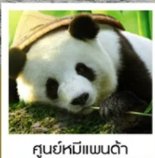
ศูนย์หมีแพนด้า