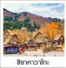
ชิราคาวาโกะ