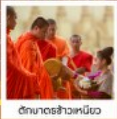
วัดมหาธาตุหลวง