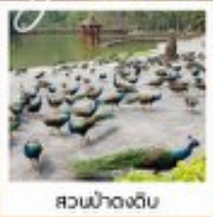
สวนป่าดงดิบ