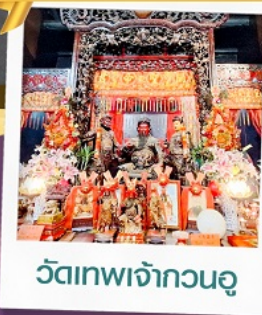
วัดเทพเจ้ากวนอู