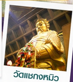
วัดเขาถกหมิว