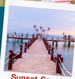
Sunset Sanato Beach Club