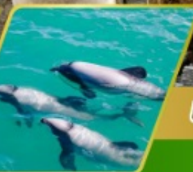
ส่องเรือชมโลมา อ่าวอาคารัว