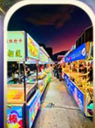
ตลาดอีหิง