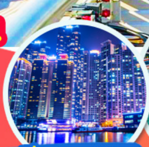
The Bay 101