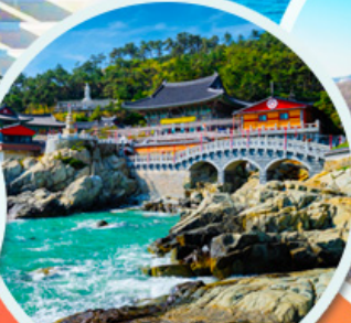
วัดแฮดง ยงกุงซา