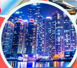
The Bay 101