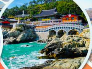
วัดแฮดง ยงกุงซา