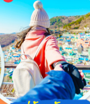
หมู่บ้านคัมซอน