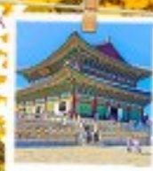
วังเคียงบกทง