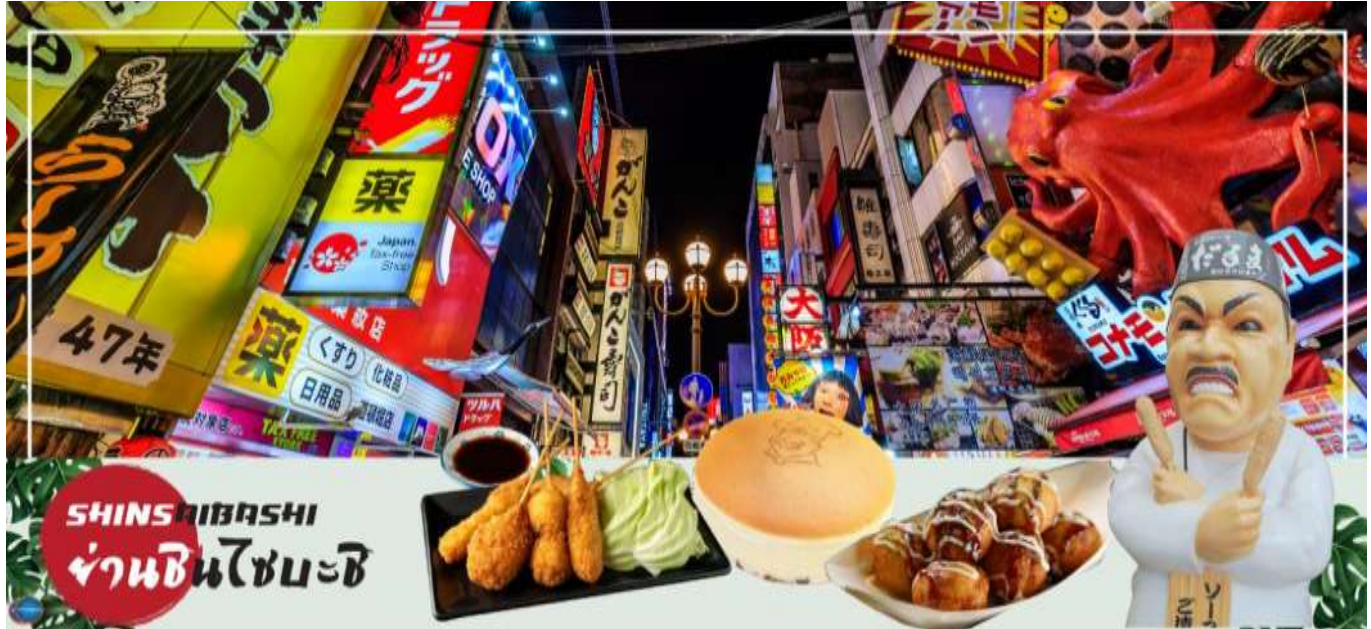
เย็น รับประทานอาหารเย็นอิสระตามอัธยาศัย

อิสระช้อปปิ้ง ย่านชินไซบาชิ (Shinsaibashi) บริเวณแหล่งช้อปปิ้งแห่งนี้มีความยาวประมาณ 600 เมตร เต็มไปด้วยร้านค้าปลีก ร้านแฟชั่นร้านเครื่องสำอางค์ ร้านรองเท้า กระเป๋า นาฬิกา ร้านกาแฟ ร้านอาหาร ร้านขนม ร้านเสื้อผ้าสตรีทแบรนด์ทั้งญี่ปุ่นและต่างประเทศ เช่น Zara H&M Beans ABC Mart เป็นต้น เรียกว่ามีทุกอย่างที่ต้องการรวมกันอยู่บริเวณนี้ ใกล้กันท่านสามารถเดินไปยัง ย่านโดทงโบริ (Dotonbori) ย่านบันเทิงยามค่ำคินดอลอดแนวถนนเลียบบคลองโดทงโบริ จากสะพานโดทงโบริบาชิไปจนถึงสะพานนิปปอนบาชิ ไฮไลท์!!! ใครๆ ก็เชคอิน ถ่ายภาพคู่ ป้ายกูลิโกะแมน หรือ ป้ายโดทงโบริกูลิโกะ (Dotonbori Glico Sign) เป็นป้ายไฟนีออนรูปนักกรีฑากำลังวิ่งอยู่บนลู่วิ่ง ซึ่งถูกติดตั้งมาตั้งแต่ ปี ค.ศ.1935 นอกจากนี้ยังมีอีกหนึ่งสัญลักษณ์สถานที่นัดพบกันหลง นั่นก็คือ ร้านปูคานิโดรากุ (Kani Doraku) ซึ่งมีปูยักษ์ขยับแขนและลูกตาได้อีกด้วย และห้ามพลาดสำหรับทาโกะยากิ อาหารท้องถิ่นของชาวโอซาก้า ที่มาถึงถิ่นแล้วต้องลอง Original Taste รับรองไม่ผิดหวังแน่นอน