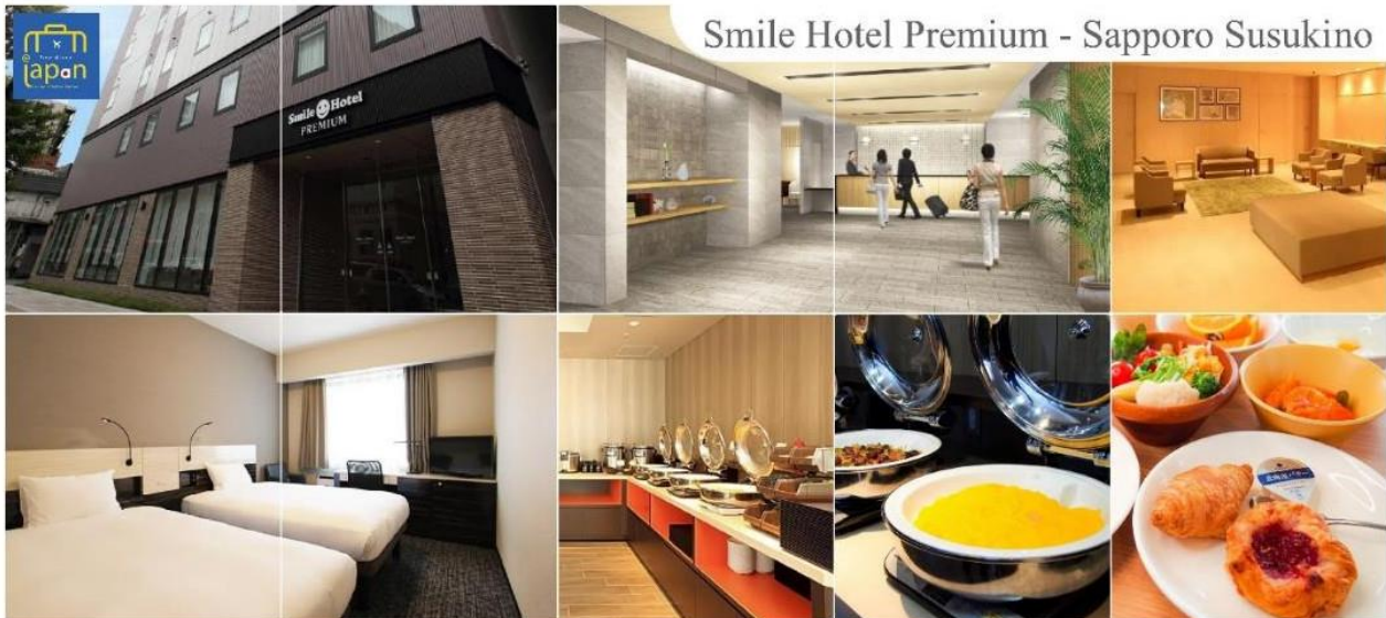
Smile Hotel Premium - Sapporo Susukino

รับประทานอาหารเย็น ณ ภัตตาคาร (4) พิเศษ!!! เมนู บุฟเฟต์ขามู + ขาปู SMILE HOTEL PREMIUM - SAPPORO SUSUKI NO หรือเทียบเท่าระดับเดียวกัน