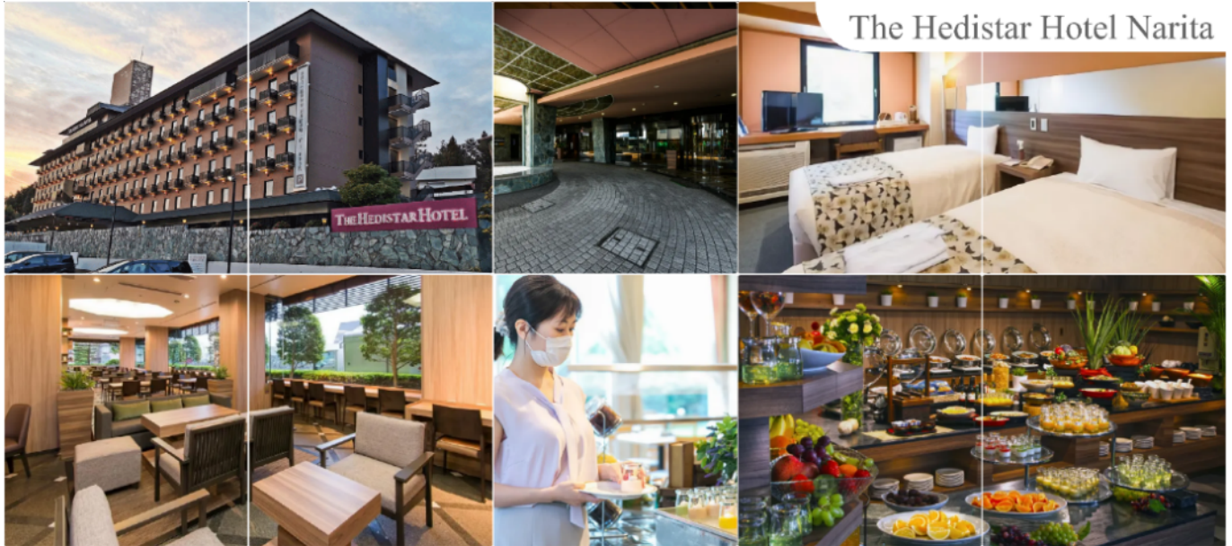
The Hedistar Hotel Narita

พักที่ THE HEDISTAR HOTEL NARITA หรือระดับเดียวกัน