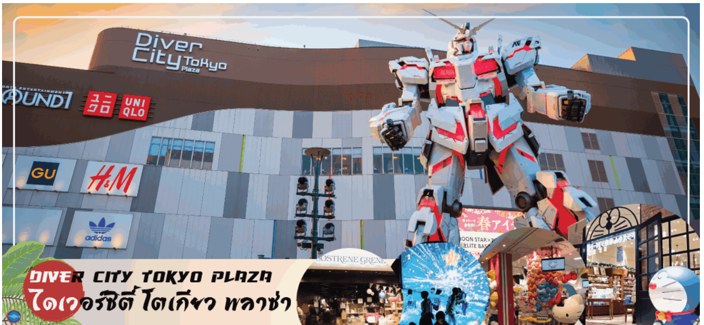
DIVER CITY TOKYO PLAZA ไดเวอร์ซิตี โตเกียว พลาซ่า

แต่ก็ยังคงความเป็นธรรมชาติไว้ด้วยความอุดมสมบูรณ์ของพื้นที่สีเขียว ไดเวอร์ซิตี โตเกียว พลาซ่า (Diver City Tokyo Plaza) เป็นห้างดังอีกห้างหนึ่ง ที่อยู่บนเกาะ โอไดบะ จุดเด่นของห้างนี้ก็คือ