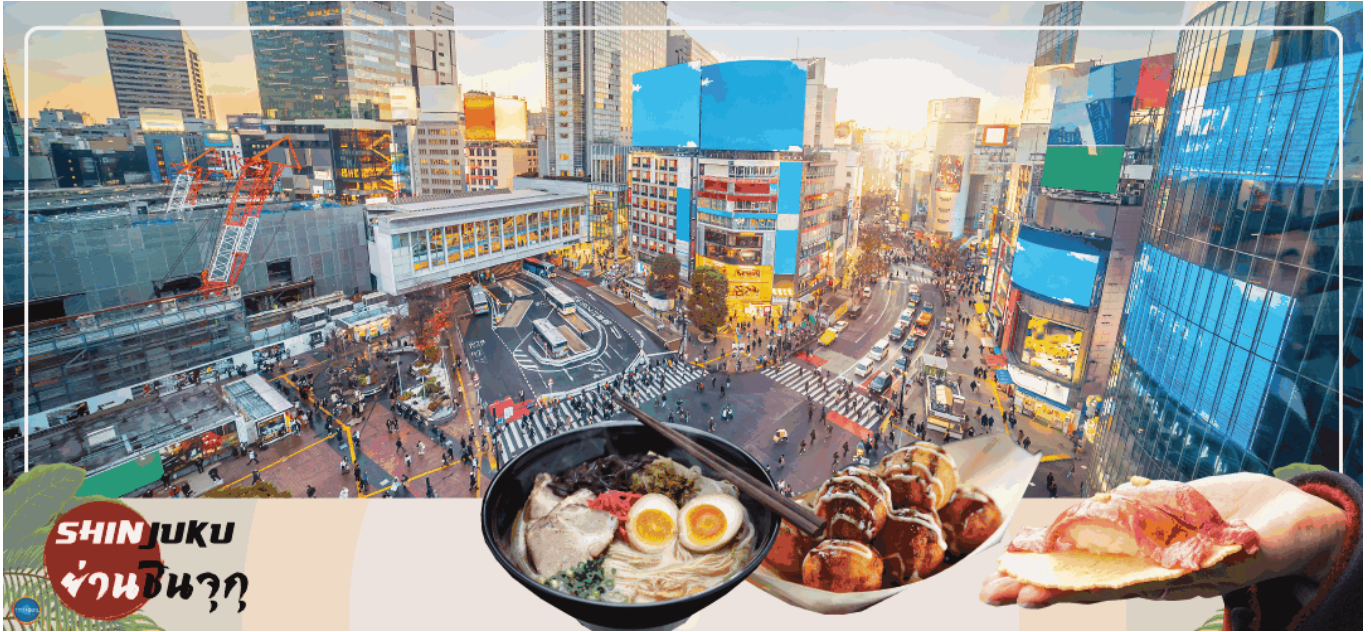
SHINJUKU ย่านชินจุกุ