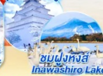
ชมฝูงหงส์ Inawashiro Lake