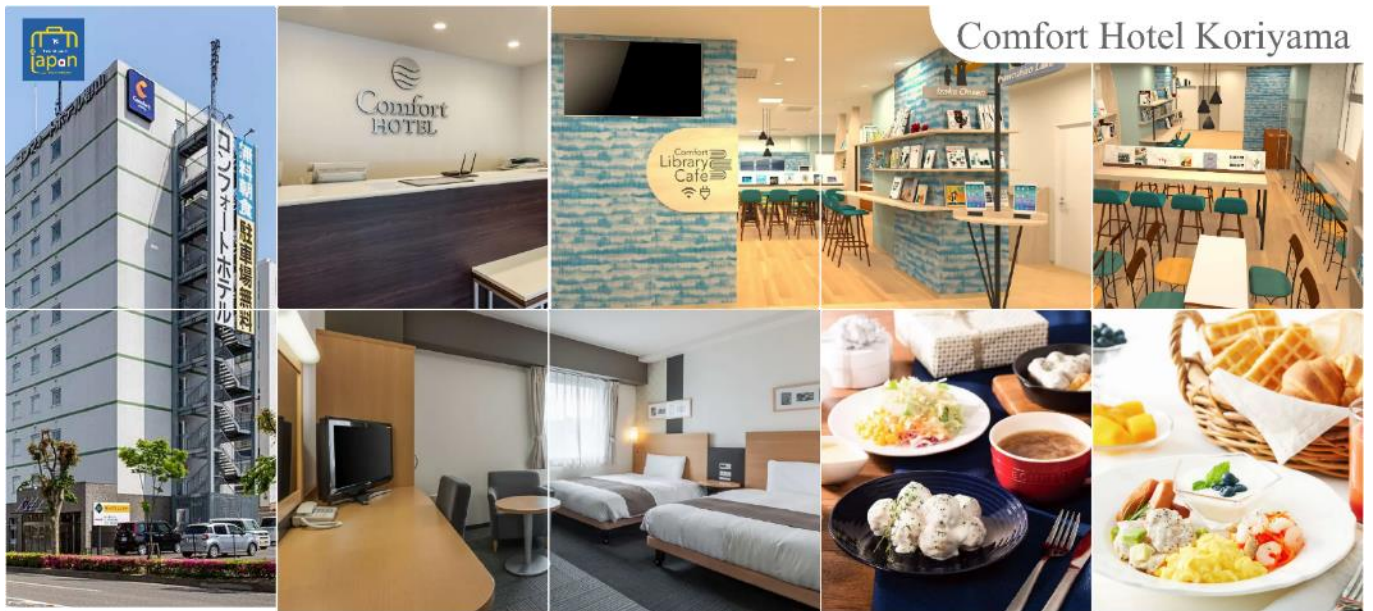
Comfort Hotel Koriyama

รับประทานอาหารเย็น ณ ภัตตาคาร (1) COMFORT HOTEL KORIYAMA หรือระดับเดียวกัน