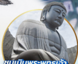
ชมเนินพระพุทธรเจ้า.. Hill of the Buddha