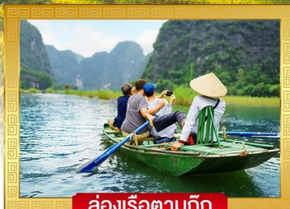
ล่องเรือตามก๊วก