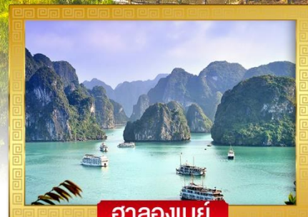
ฮาลองเบย์