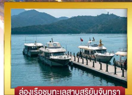
ส่องเรือชมทะเลสาบสุริยันจันทรา