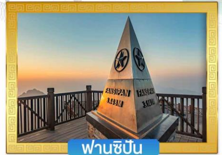
ฟานซีปิน