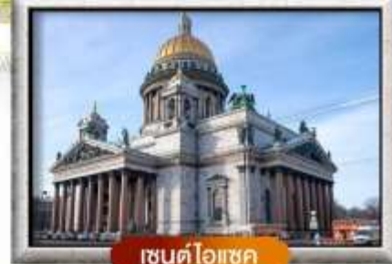
เซนต์ไอแซค