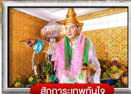
สักการะเทพทันใจ