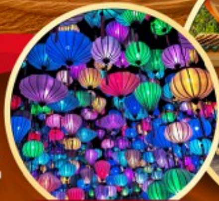
สวนแห่งแสง (Lumiere Light Garden)