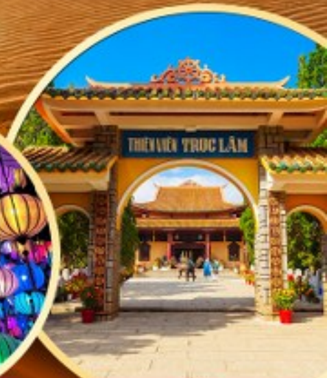
วัดตักลัม