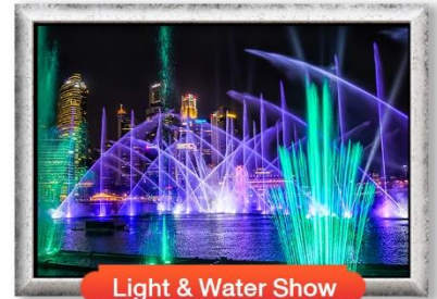
Light & Water Show