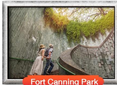
Fort Canning Park