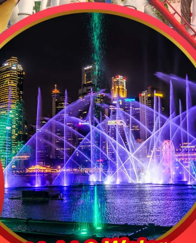
Light & Water Show