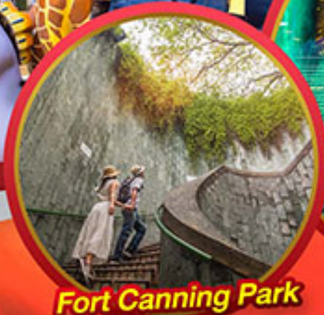
Fort Canning Park