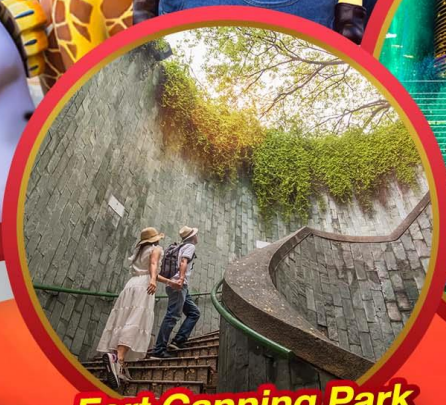
Fort Canning Park