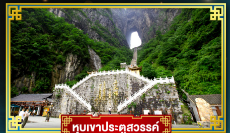
อุทยานประตูสวรรค์