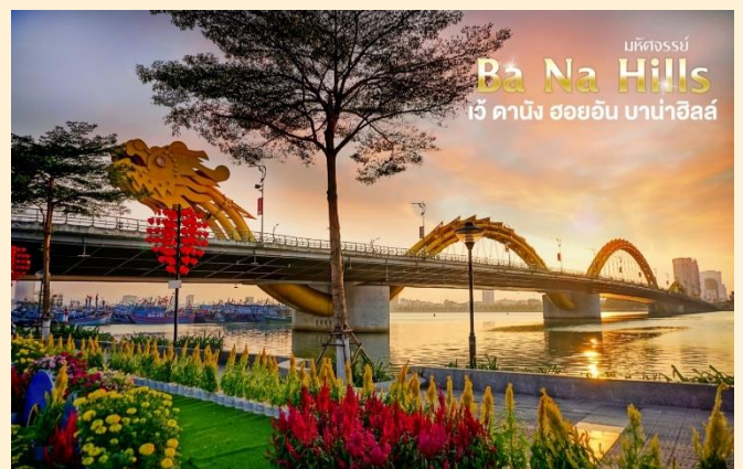
บัตดอสส์บี Ba Na Hills เว้ ดานัง ฮอยอัน บาน่าฮิลล์

อีกหนึ่งที่เที่ยวดานังแห่งใหม่สะพานมังกร ไฟสีสัญลักษณ์ความสำเร็จแห่งใหม่ของเวียดนาม ที่มีความยาว 666 เมตร ความกว้างเท่าถนน 6 เลนส์ เชื่อมต่อสองฟากฝั่งของแม่น้ำฮันประเทศเวียดนาม สะพานมังกรถูกสร้างขึ้นเพื่อเป็นแหล่งท่องเที่ยว