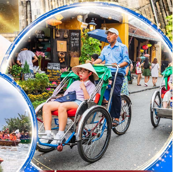
นั่งรถสามล้อชิโกล์