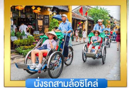
นั่งรถสามล้อชิคส์