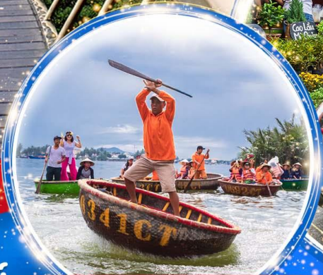
นั่งเรือกระดัง Hoi an