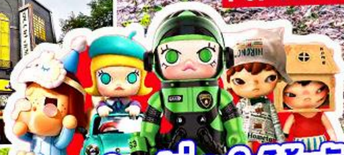
เริ่มต้น