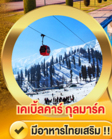
เคเบิลคาร์ กุลมาร์ค