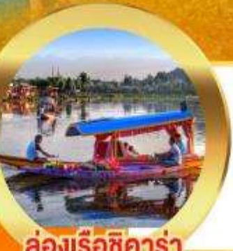
ล่องเรือชิคาร่า