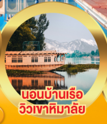
นอนบ้านเรือ วิวเขาหิมาลัย