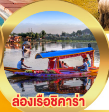
ล่องเรือซิคาร์่า