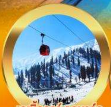
เคเบิลคาร์ กุลมาร์ค