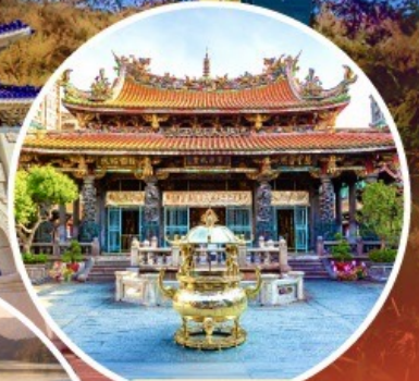
วัดหลงซาน