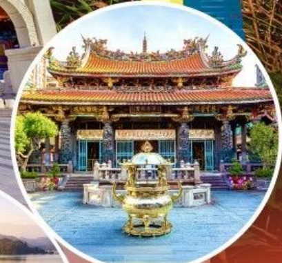
วัดหลงซาน