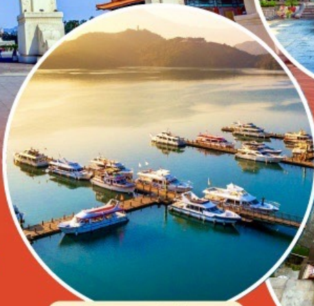
ทะเลสาบสุริยขึ้นจันทรา