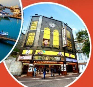
ร้าน POP MART ใหญ่ที่สุดในไต้หวัน