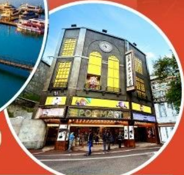
ร้าน POP MART ใหญ่ที่สุดในไต้หวัน