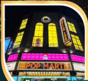
ร้านPOP MART ที่ใหญ่ที่สุดในไต้หวัน