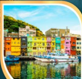
ท่าเรือเจิ้งปิ่น