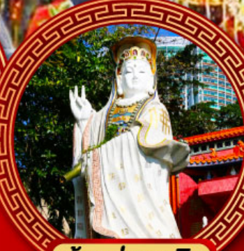
เจ้าแม่กวนอิม รีพัลส์เบย์