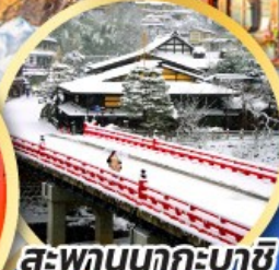
สะพานนากะบาชิ

ชมเมืองแห่งสายน้ำ บรรยากาศย้อนยุค "กุโจะจิมัง"