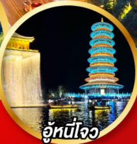
อู่หนี่โจว