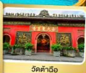
วัดต้าฉือ