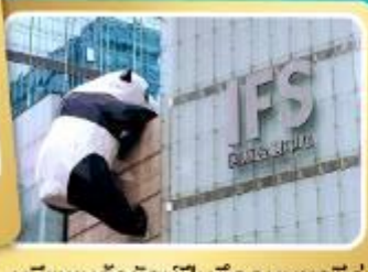
หมีแพนด้ายักษ์ปักกิ่งตักกบนซูลซู่