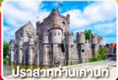
ปราสาทท่านเคานท์